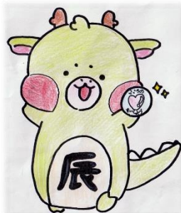
キャラクター「なやみたつのはら」 6年 HAさん