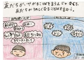
ポスター 3年 SNさん