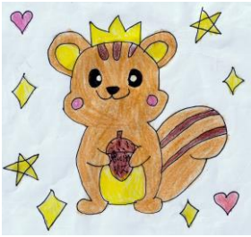
キャラクター「思いやりリス」 2年 NSさん