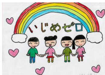
ポスター 1年 YRさん