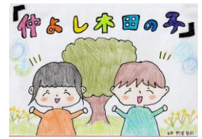
ポスター 6年 NAさん