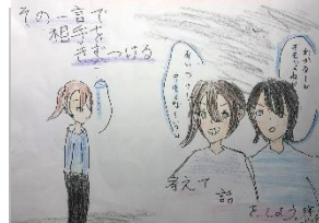
ポスター 5年 TAさん